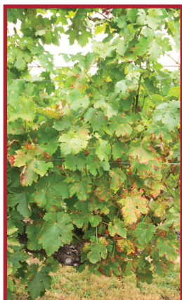
Témoin non traité