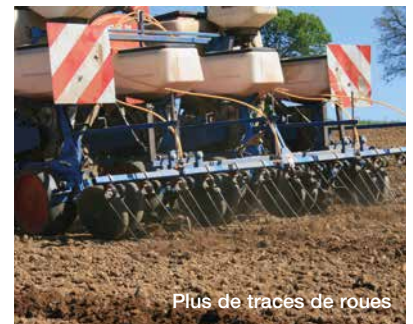
Plus de traces de roues